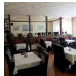
Ресторан „10“ (ГАУДЕАМУС) ул. Светозара Марковића 56. 011-3637-287