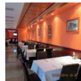
Грил Краљ Александар I Ул. Булевар Краља Александра I 011-3400-463