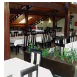
Грил ресторан „Рифат“ Ул. Милана Ракића 77 011-3812-678