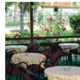
Ресторан „Студентски град“ Тошин бунар 145 011-3102-771